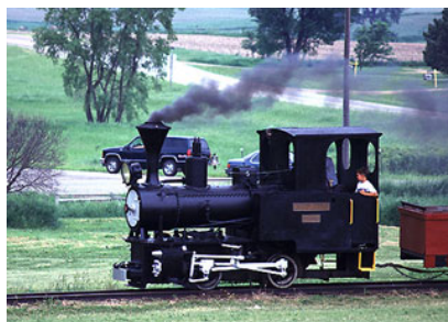
Locomotora a vapor Hibernia AG No. 7

En el caso de las tecnologías obsoletas como la locomotora de vapor, el problema merece un análisis más profundo que el hasta ahora otorgado. Comprobamos que no hay fallas en sus aspectos noemáticos ni con sus aspectos pragmáticos. Estos niveles son adecuados en todo sentido pero a pesar de ello, estas tecnologías son inútiles . Comprobamos que la rotura histórica no puede ser explicada en términos de las relaciones noemáticas y pragmáticas , ni en función de los aspectos sus onticidad y ontologicidad .