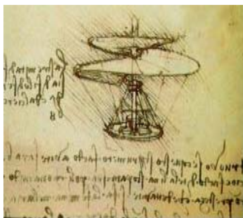
El “helicóptero” de Leonardo da Vinci Tecnologías infructuosas

La acción de aplicar curaciones a una persona sana para “curar” la enfermedad de una tercera persona enferma, es un procedimiento mágico que muestra la presencia de un “procedimiento efectivo” destinado a producir los resultados esperados. Ahora bien sabemos que este procedimiento no es congruente con las leyes del mundo. Decimos que el mago “sabe cómo hacerlo”, pero que no sabe “lo que quiere”, y que la tecnología mágica esta rota en su noematicidad . Por supuesto, no todos los casos son transparentes y cada caso es diferente de los demás. Podremos encontrar casos en los que las tecnologías mágicas son “eficaces”. Pero en esos casos, la efectividad se debe a razones accidentales ajenas a su naturaleza tecnológica.