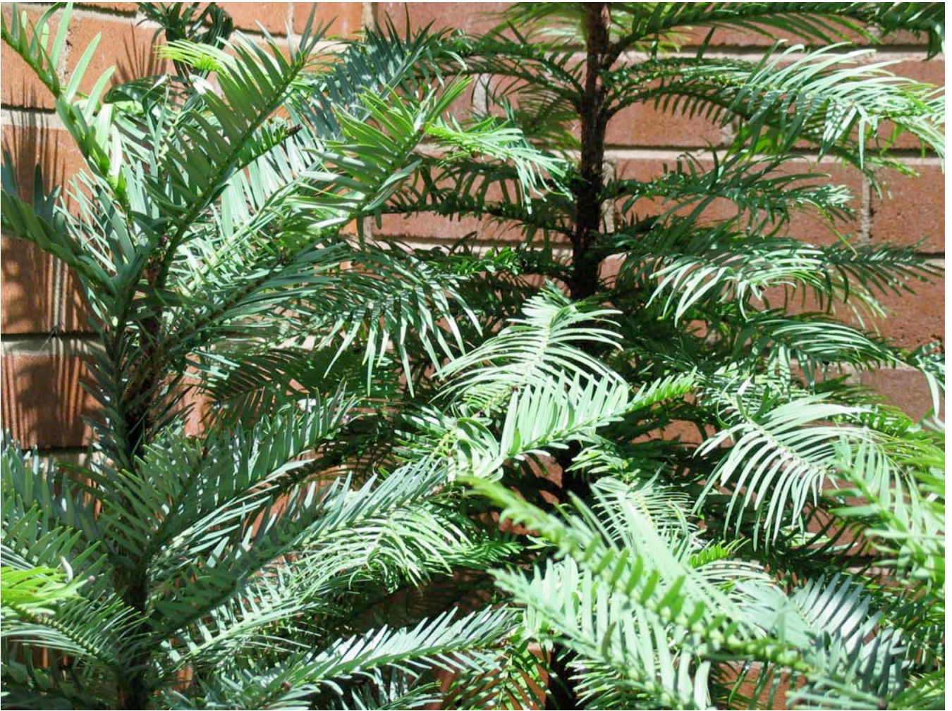
Fig. 1. Wollemitall Wollemia nobilis , en unik representant för familjen Araucariaceae som upptäcktes i isolerade bergsområden i New South Wales 1994. Bilden visar uppklonade sticklingar från Canberra Botanical Garden, Australien.

finns dock även andra former av artbildning – främst inom växtvärlden – som polyploid och hybridisering. Arter förändras med tiden och kan ses som utvecklingslinjer inom evolutionsprocessen. Ökad kunskap om artbildning och utdöende behövs, bl.a. eftersom det ytterst är hastigheten i dessa processer som är så att säga drivmotorn i biodiversiteten.