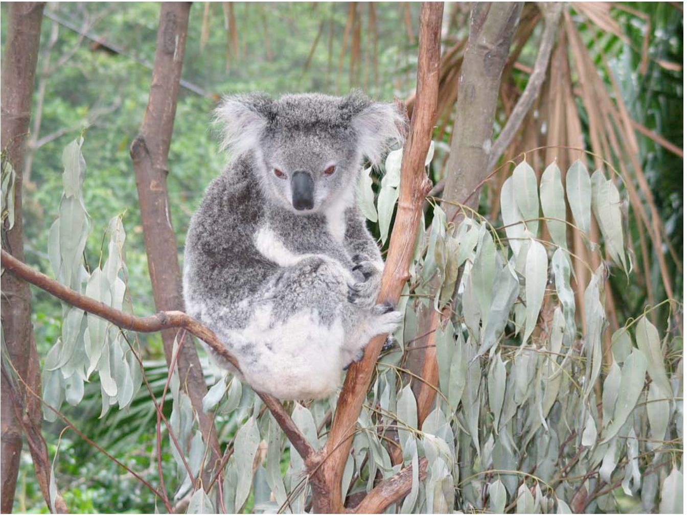
Fig. 3. Koala Phascolarctos cinereus , på plats i ett feberträd Eucalyptus globulus . Koalan är idag starkt undanträngd i hela Australien. Den lever uteslutande av blad från olika arter av Eucalyptus .

Är det rimligt att förvänta sig att man ska kunna ge svar på frågan hur många arter det finns på jorden? Knappast. Många biotoper och organismgrupper är mycket bristfälligt studerade, och de resurser som skulle krävas för en kraftig kunskapsuppbyggnad över hela linjen är mycket stora. Man har beräknat att det skulle behövas omkring 1 400 – dvs. var femte – av världens ca 7 000 systematiker för att inom loppet av en rimlig tidsperiod inventera samtliga taxa inom en ett hektar stor, representativ skogsyta (Lawton m.fl. 1998). Ändå pågår omfattande inventerings- och karteringsarbeten på många håll i världen. Flera olika webbaserade organisationer samverkar också för att kunna koordinera och förmedla uppgifter om beskrivna arter på ett lätt-hanterligt vis; exempel på dessa är All-species foundation ,