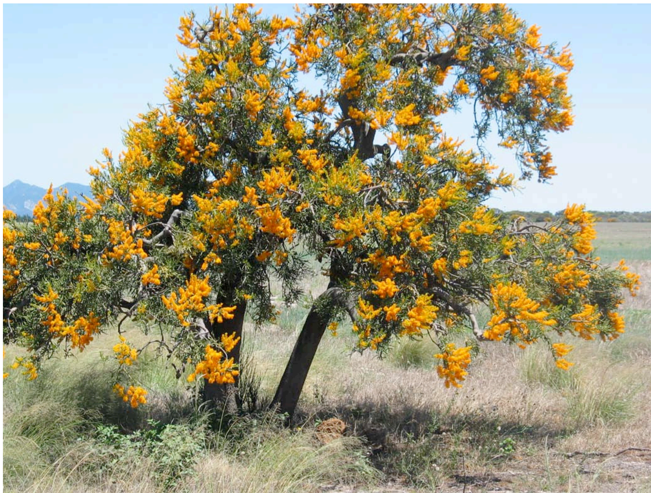
Fig. 2. Västra Australiens vackraste "omslagsblomma" Nuytsia floribunda , Christmas Tree, som tillhör mistelfamiljen, är endemisk för de sydvästra delarna av kontinenten. Trädbildande mistlar är för övrigt unikt för Västra Australien, och familjen omfattar mest örtartade halvparasiter som bland annat förekommer på många olika Eucalyptus -arter.

försök har gjorts att beräkna antalet genom m.e.l.m. avancerade räkneövningar och extrapoleringar, och resultaten har pekat på allt från 2 till 100 miljoner arter. De flesta av världens kända arter är utbredda inom tempererade områden, och om vi antar att det finns 2–3 gånger så många arter i tropiska områden kan man räkna med 5–8 miljoner arter. Ett exempel är en omdiskuterad beräkning av artantalet i världen till ca 30 miljoner, grundad på en studie av tropiska skalbaggar där leddjursfaunan i 19 trädindivider av en tropisk art i Panama undersöktes under tre säsonger (Erwin 1997). Totalt omfattade studien 1 100 arter skalbaggar varav det uppskattades att 160 var värdspecifika, dvs. förekommer endast på en trädart. Skalbaggar utgör ca 40 %