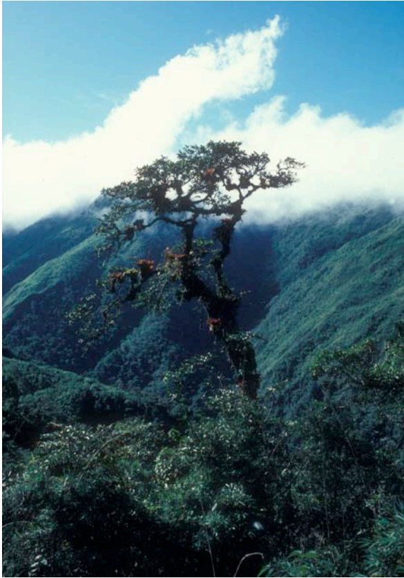
Fig. 8 (t.v.) och Fig. 9 (nedan). Regnskogarna på Andernas västsluttningar hör till världens s.k. hotspots – dvs. de har en exceptionellt hög artrikedom. Många av dessa skogar avverkades på bara några decennier under senare delen av 1900-talet. Enligt vissa beräkningar har 90 % av de ursprungliga skogarna försvunnit. Foto: Tomas Carlberg, sluttningar väster om Quito, Ecuador, 1987.