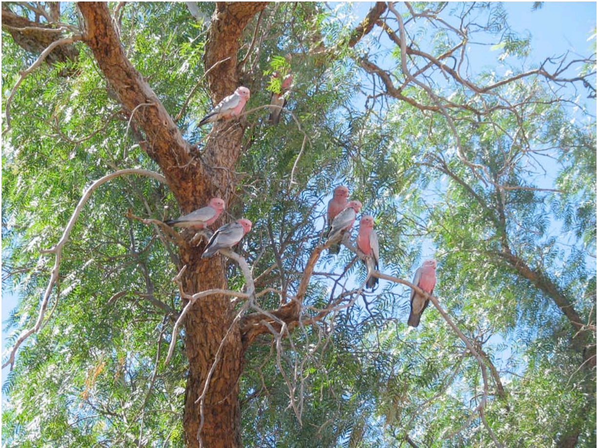
Fig. 7. Rosenkakadua Eolophus roseicapillus (Galah på engelska) är en av de mest vittspridda av Australiens 53 arter papegojor. De flesta arterna är endemiska för Australien.

Områden med exceptionell artrikedom – hotspots. Den biologiska mångfalden är ojämnt fördelad på jorden. De stora biomen på norra halvklotet innehåller relativt få arter medan troligtvis över hälften av alla kända arter förekommer i den tropiska regnskogen, vars areal dock minskat dramatiskt under 1900-talet; idag utgör den endast 6 % av jordens landyta av uppskattade 12 % för några tusen år sedan. Latinamerika har 57 %, Sydostasien och Stillahavsområdet 25 % samt Afrika 18 % av den återstående regnskogsarealen kvar. På olika håll i världen finns områden som är exceptionellt artrika; t.ex. finner man i ett område mellan de tre länderna Colombia, Ecuador och Peru fler än 40 000 blomväxter på en yta som motsvarar 2 % av