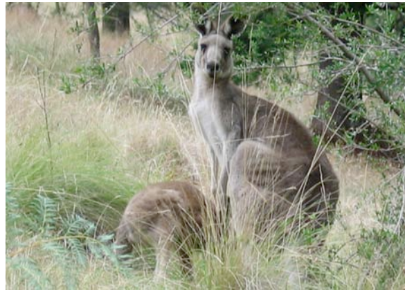
Fig. 6. Grå jättekänguru Macropus giganteus är en av de vanligaste arterna av stora känguruer. Den förekommer i östra delen av Australien. Totalt omfattar kängurudjuren 45 arter, varav 14 tillhör släktet Macropus , som lever på marken i öppna biotoper.

domligt släkte inom familjen araucariaväxter (Araucariaceae) från relativt isolerade bergsområden väster om Sydney (Fig. 1).