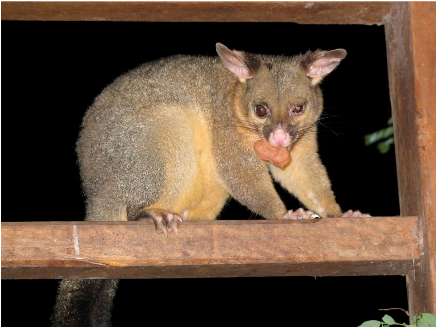
Fig. 11. Nya Zeelands "public enemy number one" rävkusu Trichosurus vulpecula . Efter införandet till Nya Zeeland från Australien har arten spridit sig i enorma populationer, och är idag ett hot mot många arter inom den unika inhemska fågelfaunan genom plundring av ägg.

tionen omfattar nu ca 70 miljoner individer, vilka åstadkommer stora skador på vegetation och inhemska fauna. Rävku su har blivit förklarad som "public enemy number one" (Fig. 11).