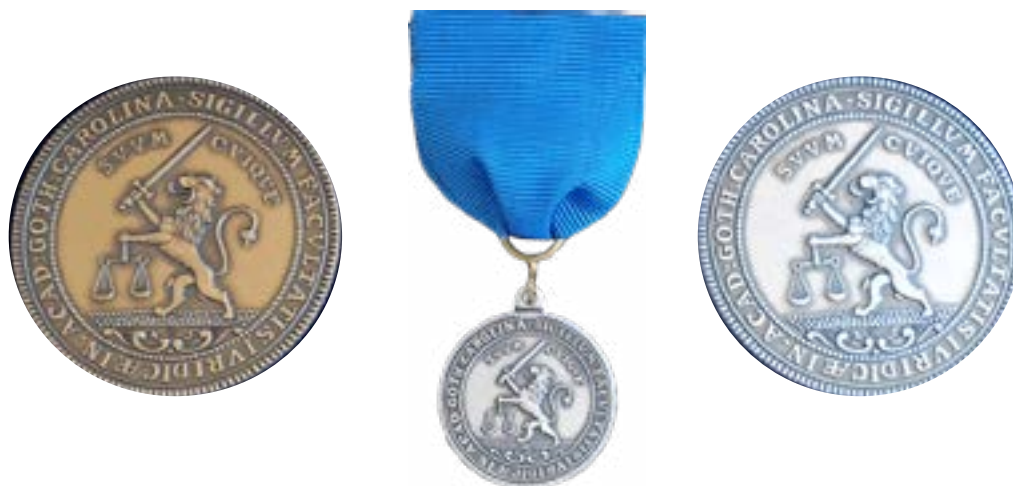
Juridiska fakultetens medaljer