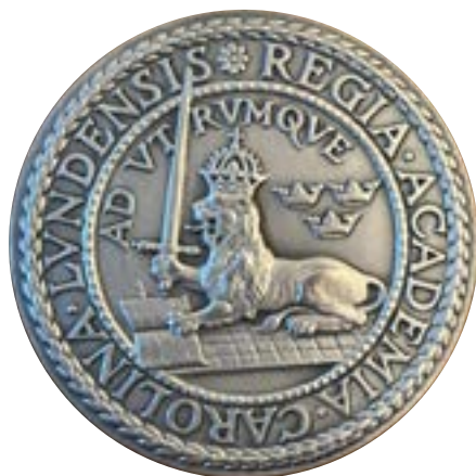
1960 års belöningsmedalj i silver