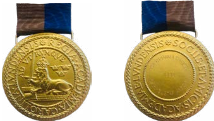
1960 års belöningsmedalj i guld