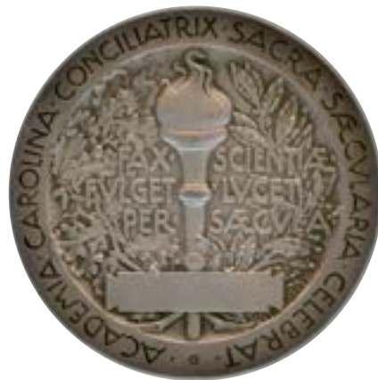
1918 års medalj i silver