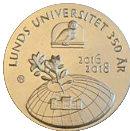
2016–18 års medalj i guld