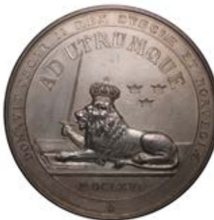
1868 års medalj (åtsida och framsida)