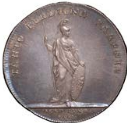
1733 års medalj (åtsida och framsida)