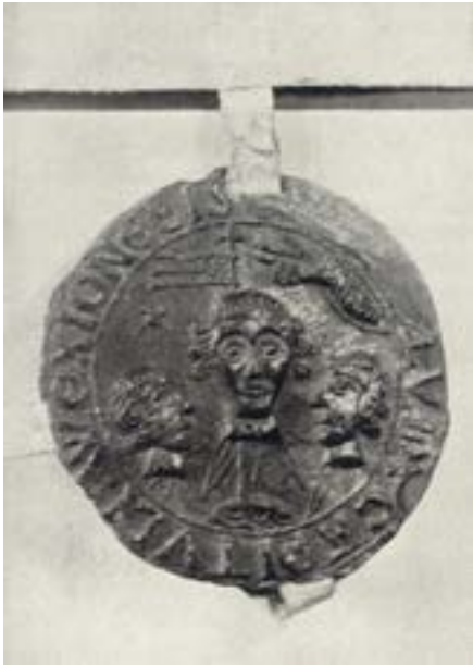
En av de få illustrationerna i Schmidts avhandling visar Växjö domkapitels sigill från 1292 med de tre martyrerna Unamans, Sunamans och Vinamans avhuggna huvuden.