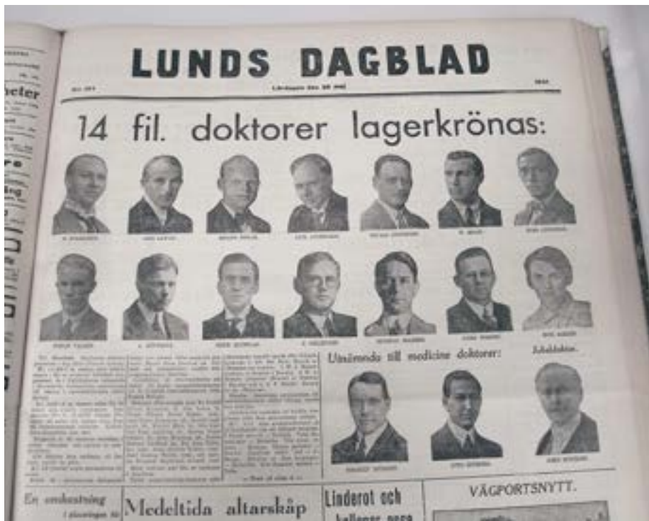
Lunds Dagblads förstasida på Filosofiska fakultetens promotionsdag den 30 maj 1931. Schmid återfinns sist i den andra raden av porträttfoton. Den tredje raden visar de tre herrar som samma dag utsågs till medicine doktorer vid en enklare "doktorsutnämning", något som på denna tid ordnades de år respektive fakultet inte höll full promotionshögtid.